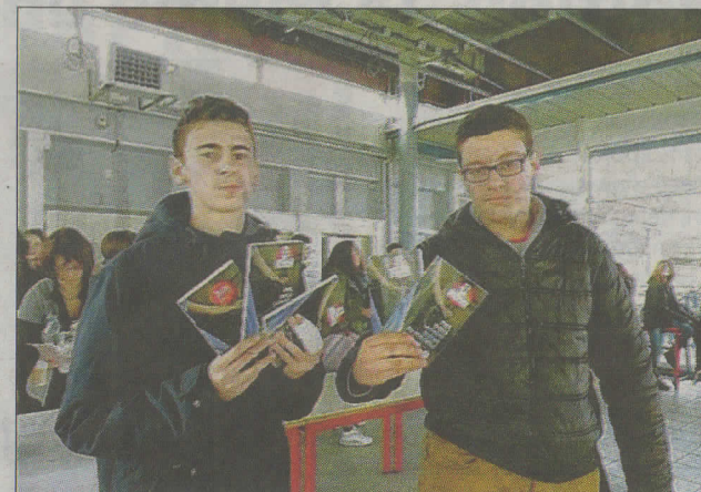
Des élèves du lycée, lors du pot qui a suivi la remise du prix.

À la suite de la lecture, les élèves effectuent plusieurs travaux: l'écriture d'une critique chacun d'un roman de leur choix, puis un travail de photographies, en groupe, autour du thème de leur livre préféré. «Le but